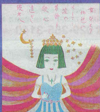
美空ひばり「クレオパトラ…」

各界著名人の美術作品を紹介する「文化人・芸能人の多才な美術展」が9月27日(月)まで、取手市取手の「とりでアートコンシェルジュ」で開かれている。12回目となる今年のテーマは「拡げよう文化の輪・芸術は世界を救う!」。芸能人や歴代総理、漫画家など91人が約160点を出品している。県内では3回目の開催。